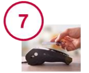
Gestion des paiements